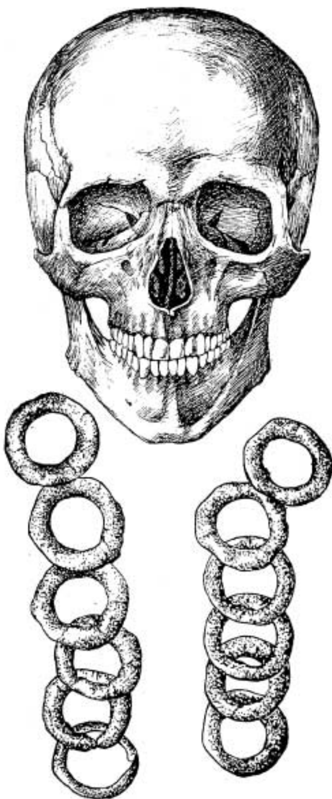
Рис. 1. Боровянка-XVII. Могила 8. Бронзовое нагрудное украшение.